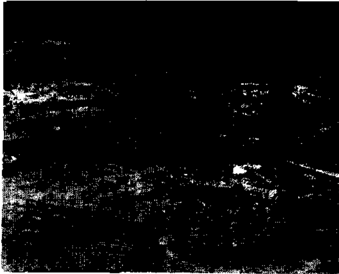
Wohnraum, dahliger Schmiede und Korridor