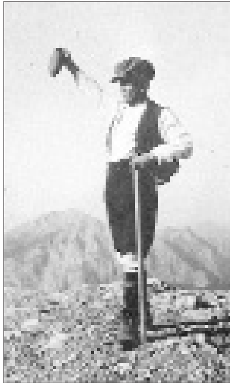
Abb. 6: Auf dem Weg zum Venediger, etwa an der Stelle des ehemaligen Gumpbachkreuzes, am 5.10.1929.

papst« mit 132 Großvenedigerbesteigungen, nicht wesentlich. 33