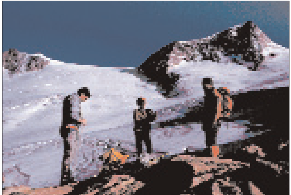
Abb. 13: Vorbereitungen am Mullwitz-Aderl zur Durchquerung des Mullwitz-Kees auf dem Weg zum Großvenediger (6.9.1986).

pflgte er selbst in großen Höhen mit beiden Beinen auf der Erde zu stehen, ohne sich selbst zu verstecken, sondern ganz einfach der „Resinger“ zu bleiben. In den Bergen war er nämlich souverän, ganz besonders am Venediger, wo er keinen Respekt vor nichts und niemandem kannte, auch nicht vor einem Bischof. Ihm – wahrscheinlich handelte es sich um Bischof Sigmund Waitz – soll er nach einem schweißtreibenden Anstieg zum Venediger statt eines Glückwunsches zum Gipfelsieg lediglich gesagt haben: „Bischof, Du stinkst!“ 60