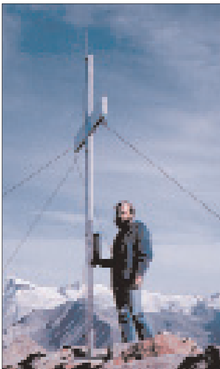
Abb. 12: Am Gipfel des Lasörling (3098 m). Im Hintergrund der Großvenediger und das Rainerhorn, am 21.9.1985.