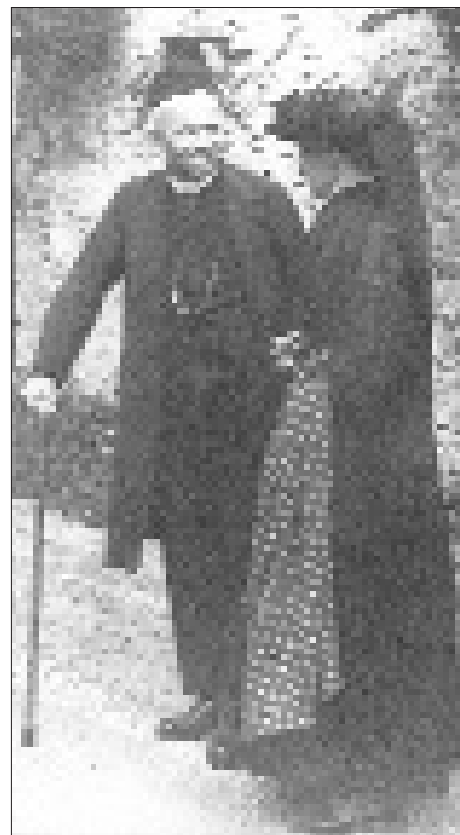
Abb. 8: Der „Venediger-Papst“ mit Stock, nach seiner Erkrankung bei einem Spaziergang in Virgen vor dem „Winkler-Kreuz“.

Wo der Grund für Resingers Sepsis tatsächlich zu suchen ist, – die Krankenblätter aus der damaligen Zeit sind im Allgemeinen Öffentlichen Bezirkskrankenhaus in Schwaz, wo Resinger damals behandelt wurde, nicht mehr vorhanden – läßt sich nicht mehr eindeutig feststellen. Sicher ist hingegen, daß sie ihn im Herbst 1934 auf das Krankenbett geworfen hat, von dem er sich erst nach 16 Monaten, zahlreichen operativen Eingriffen und mit einem steifen rechten Hüftgelenk wieder erheben konnte. Kurz nach seiner Entlassung aus dem Krankenhaus hat Resinger über sein Befinden folgenden Bericht gegeben: 48 „Am 15.1. verließ ich die casa del dolore, aber schon am 17. warf es mich wieder mit hohem Fieber ins Bett für 10 Tage. Nun gehts wieder besser, gottlob, ich kann wieder Messe lesen! Im Gehen fast keine Fortschritte, Fuß nicht biegen, nicht selber an- und ausziehen und immer starke Schmerzen; alle Narben beteiligen sich am concerto grosso, besonders eifrig